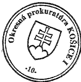
JUDr. Marián Čorba prokurátor okresnej prokuratúry

Vzhľadom k vyššie uvedeným okolnostiam, je nevyhnutné konštatovať, že Všeobecne záväzným nariadením mestskej časti Košice – Staré mesto č. 2/2016 o pravidlách času predaja v obchode a času prevádzky služieb na území mestskej časti Košice – Staré mesto, boli porušené ustanovenia § 6 ods. 1, ods. 2, ods. 7, § 13 ods. 5 veta druhá, § 18d ods. 1 a ods. 2, § 18f ods. 1, § 25 ods. 4 písm. e) zákona č. 369/1990 Zb., § 2 ods. 2, § 7 ods. 3 zákona č. 513/1991 Zb., § 17 ods. 1 zákona č. 455/1991 Zb. a § 2 ods. 1 zákona č. 372/1990 Zb., čo odôvodňuje zrušenie predmetného všeobecne záväzného nariadenia ako nezákonného.